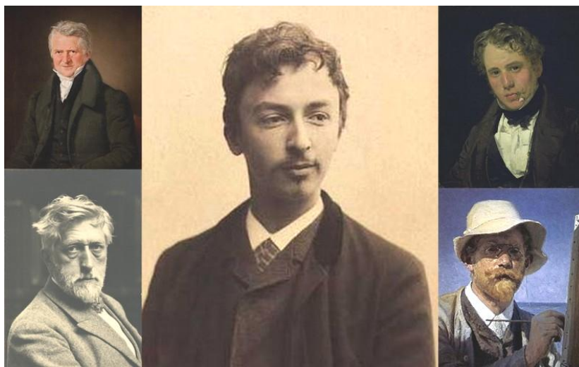
C.W. Eckersberg J.F. Willumsen

Le thème de la conférence sera le suivant: Les arts sont les reflets de l'âme d'un peuple. Par la connaissance des peintres et de leurs œuvres il est possible de connaître le caractère d'un pays et de sa population. Que montrent Eckersberg, Marstrand, Krøyer, Hammershøi ou Willumsen ainsi que de bien d'autres artistes de ce Danmark, entouré d'eau, baigné par la luminosité estivale de Skagen et les grisailles hivernales Copenhagoises? Par le biais des œuvres, une tentative de réponses sera faite.